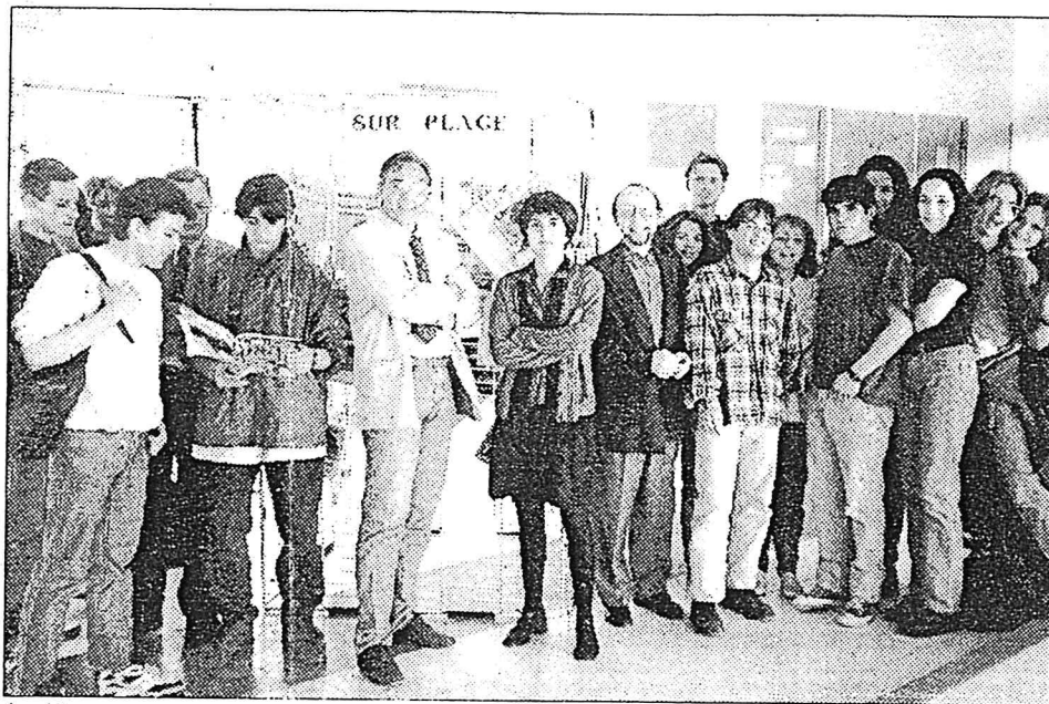
Les élèves du lycée entourent les conférenciers