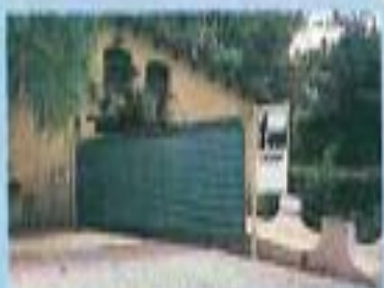
Argelès: "La Stréme". Les postes de lavage permettent d'évacuer les eaux usées.

Loisirs: Jeux enfants, piscine, tennis, animations.