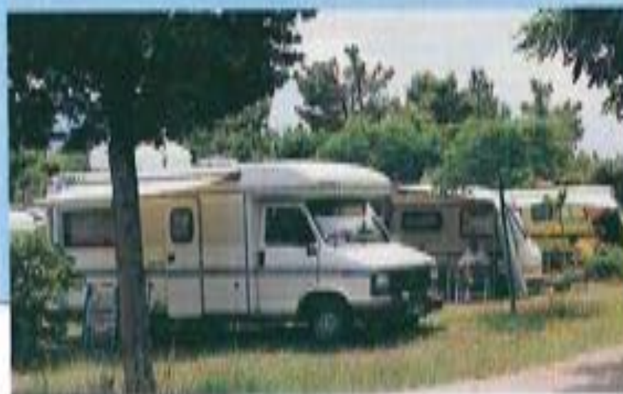
Argelès: "Municipal Le Roussillonnais". Une priorité, la recherche de l'ombre.

Notre avis: Un camping à taille humaine, très bien équipé. Des emplacements ombragés avec d'impressionnantes peintures le long des allées et