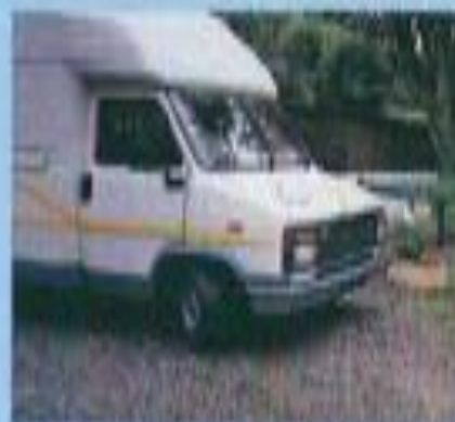
Collioure: "La Giraffe".

Tel: 06 21 07 12. Tarifs: Personne: 30 F / emplacement: 45 F / électricité: 13 F. Dates d'ouverture: 1er juin à fin septembre, réservation demandée. Nombre d'emplacements: 630. Équipements: 5 sanitaires, machines à laver,