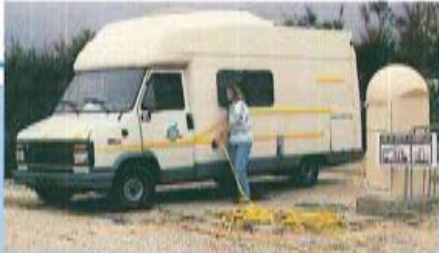
Canet-Plage: "Le Brasilia" et sa Borne Cathare.

Témoin d'une période troublée, Salses est merveilleusement préservée des assauts des armes comme de ceux du temps.