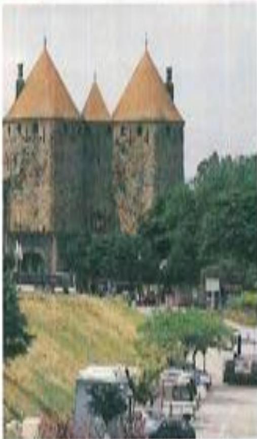
"Et nous verrons les tours de Carcassonne se profiler à l'horizon de Barbastro".

que soit l'itinéraire choisi. Il ne vous reste qu'à vous faire le palais pour goûter à toute la différence de ces crus.