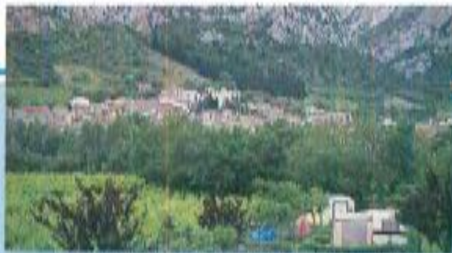
Toutavès "Le Priourat", taille humaine face au berceau du plus vieux camping.

Sur la RN 113, Barbaira existe bel et bien, petit village que sa célébrité musicale n'a guère dérangé dans ses quêtes habituelles. Mais de tours de Carcassonne à l'horizon... point! Serait-ce un artifice poétique? Non. Finalement, Trénet n'a pas menti. Il suffit de prendre le chemin vicinal qui conduit aux ruines du château de Miramont pour découvrir un impressionnant panorama sur la vallée de l'Aude et, comme à portée de main, Carcassonne.