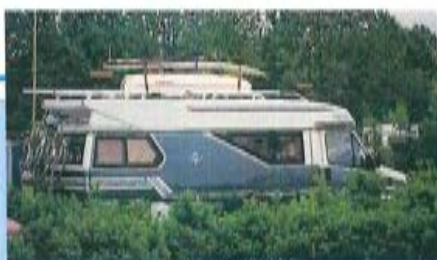
Carcassonne: "La Cité".