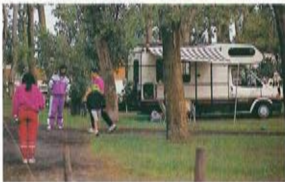
Découvrir Collioure, faire étape dans le superbe terrain de "La Yole" (Valras-Plage), le Languedoc-Roussillon mérite plus qu'un détour.

Pour notre sélection d'étapes, priorité au soleil. Notre destination vise en effet la frange sud du Golfe du Lion. Espace privilégié des amateurs de plaisirs nautiques, le Languedoc-Roussillon abrite d'innombrables terrains de camping. Nous en avons testé 22. En camping-car, bien sûr. Et tout au long d'un fil directeur dont le guide... est un sacré poète!