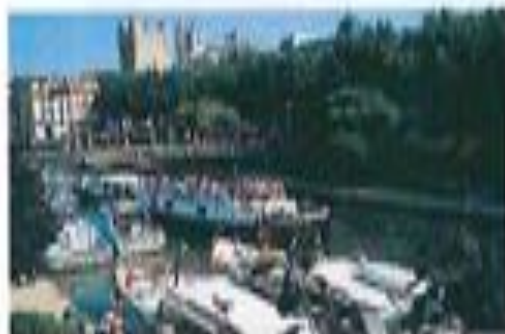
A Narbonne, à quelques pas du Quai des barques, Charles Trénet a vu le jour.

Le premier rendez-vous de cet itinéraire de