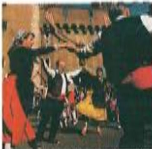
Sous le Castillet de Perpignan, la Sardana se danse toujours mais dans la mer, comme dans la chanson.

Les étangs d'aujourd'hui sont le point de rendez-vous des véliplanistes, dont bon nombre sont camping-caristes. L'eau, à peine plus profonde d'un mètre, sécurisé n'importe quel débutant et la tramontane, lorsqu'elle se met à souffler, aide à battre des records de monde de vitesse. L'endroit, on le comprend, est fort fréquenté. Trénet ne l'avait-il pas rêvé en décrivant ce bateau blanc qui "fait semblant de voler en l'air" ?