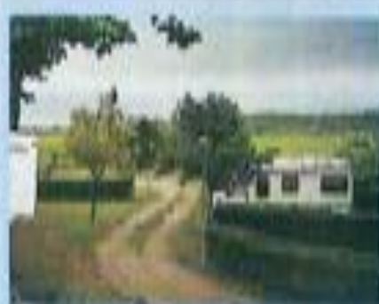
Fabrezan: "Camping Municipal".

Les vieux villages de bord de mer ont disparu, étouffés dans le béton. Seuls les bourgs plus éloignés du rivage ont su garder leur personnalité. Charles Trénet, lui, s'est installé à Canet où vous aurez peut-être la chance de le croiser. C'est là, croit-on savoir, que se trouvait "le piano de la plage".