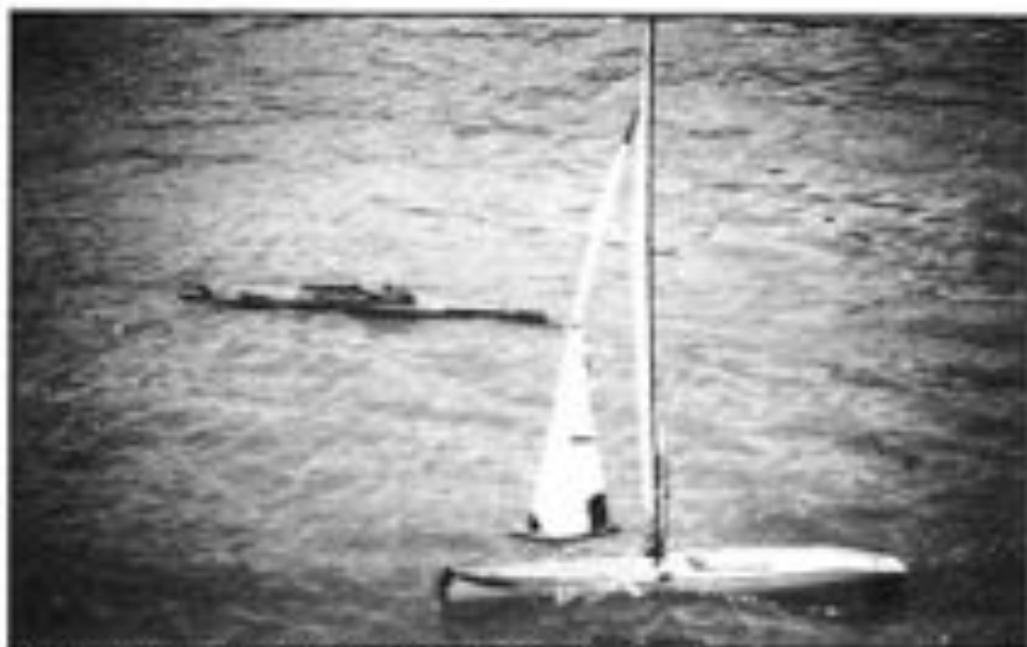
Bord à bord, régler et sous-marins n'est pas pour des nageas.