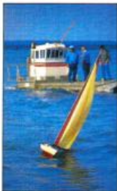
À l'allure, on évitait un véritable cyclone.

et il faut savoir éviter les lames de sable ou les puits à ballast. En 1990, la première édition a été un test.