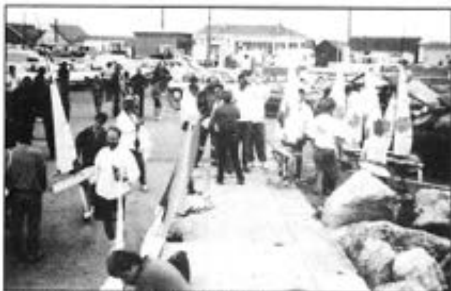
Ambiance de régime sur le port de Bourgneuf.