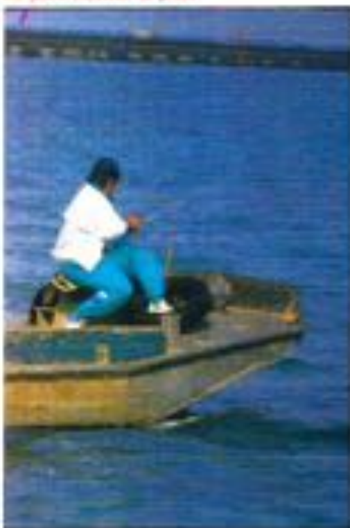
Un bon bateau de près.

Deux concurrents s'y sont inscrits, huit seulement étaient à l'arrivée après 1 h 45 de course ! C'est qu'il a fallu jouer avec le vent et sortir du creux atteignant près de 70 cm : une véritable tempête pour les modèles réduits. Néanmoins, la traversée était réalisable.