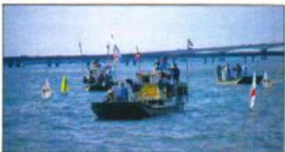
En petites groupés où les "1 mètre" font presque jeu égal avec les "Classe M".