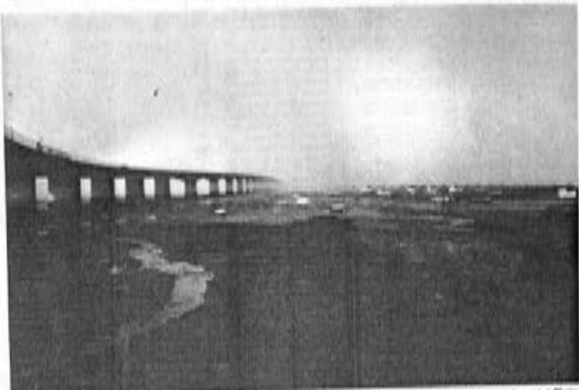
Si la Maison du Tourisme était créée dans les locaux du péage, les touristes pourraient s'informer avant de s'engager sur le pont.

Sur la base de l'ancien hôtel, seront créés un centre de documentation, un centre de formation et un centre de conseil aux touristes. Une dizaine de bureaux seront créés dans les communes de l'île.