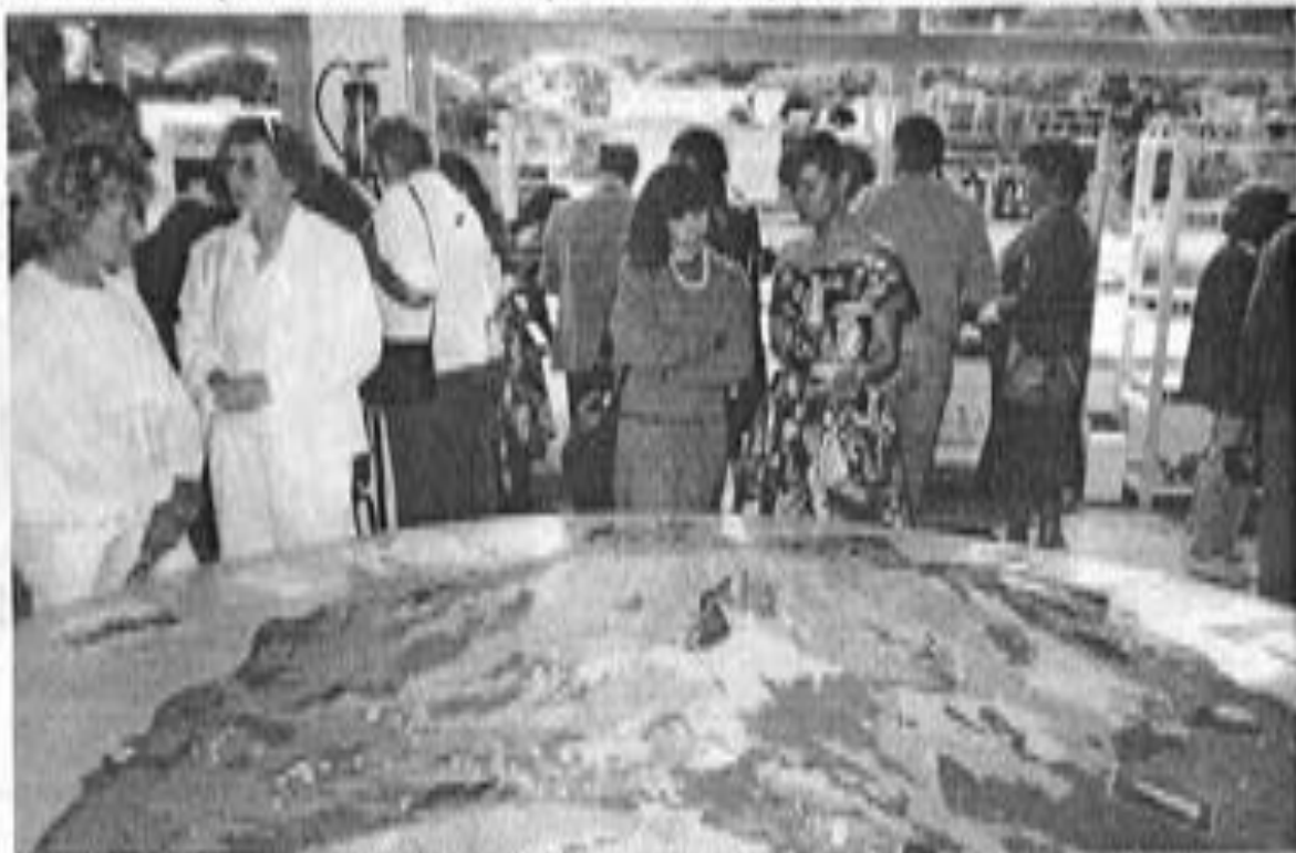
Around d'une vaste maquette de la Réunion en relief, de charmantes habitantes feront découvrir aux visiteurs les produits de leur île.

Un groupe de chanteurs réunionnais s'est constitué avec l'aide d'une association. Le groupe est composé de six personnes. Les chanteurs de la Réunion ont participé à l'exposition. Les chanteurs de la Réunion ont participé à la promotion de la Réunion. Le groupe de la Réunion a participé à la promotion de la Réunion. Le groupe de la Réunion a participé à la promotion de la Réunion.