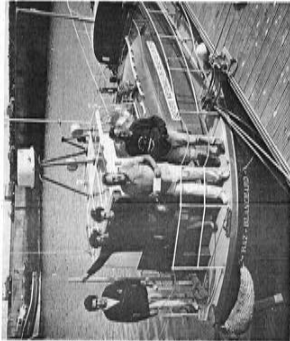
À bord de « Alce Blanchard » qui sera bientôt à la voile. Sur l'arrière, M. et M. Blanchard, vice-président de la SNSM, un équipage de 20 personnes.

La Société de Sauvetage en Mer va bientôt recevoir sa nouvelle vedette