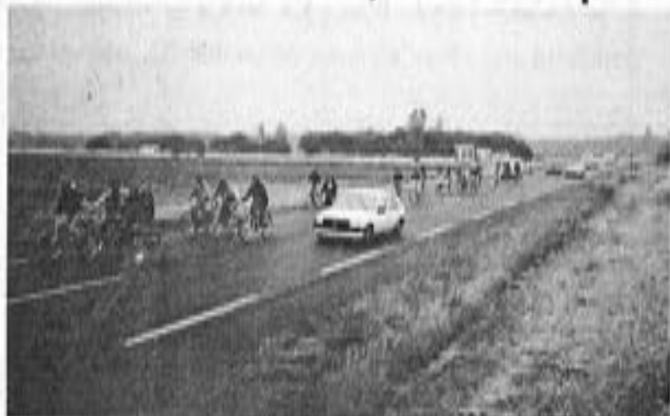
Quelques dizaines de vélos sur la route nationale, il en faut peu pour embouteiller la plus grande des routes insulaires.