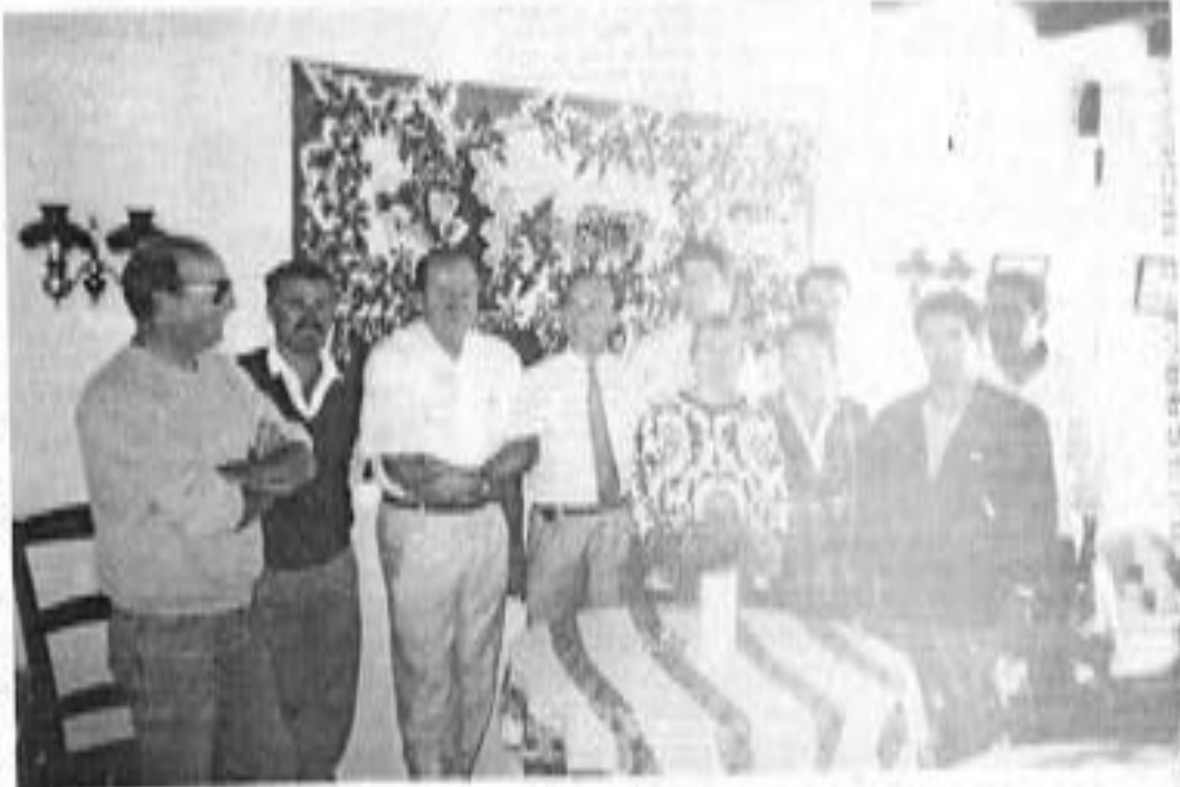
Hôteliers et restaurateurs unis pour défendre l'île d'Oléron et la qualité de l'accueil touristique.

Cette action se fera en 1980. Le club des hôteliers et restaurateurs de l'île d'Oléron a été créé le 24 juin 1980. Son objectif est de promouvoir les établissements de l'île par des actions collectives. Cette démarche «insulaire» a été longue à mûrir. Elle se veut complémentaire des actions de développement touristique.